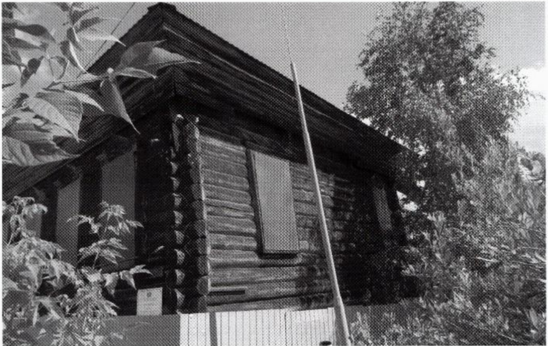
Фото 3. Объект культурного наследия «Дом жилой» ( г. Тобольск, ул. Горького, 33). Вид на торцевой фасад объекта. Фото 2025 г.