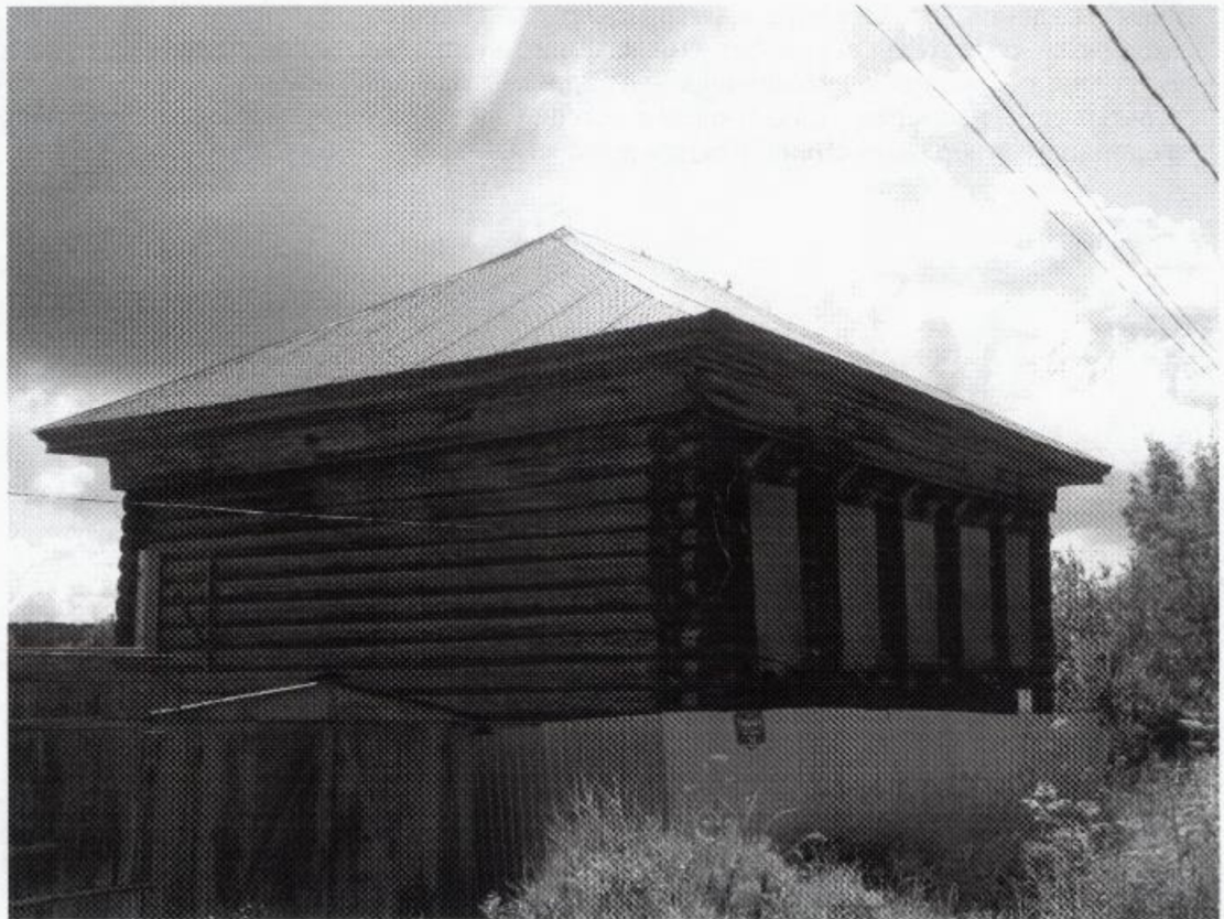
Фото 1. Объект культурного наследия «Дом жилой» ( г. Тобольск, ул. Горького, 33). Общий вид объекта. Фото 2025 г.