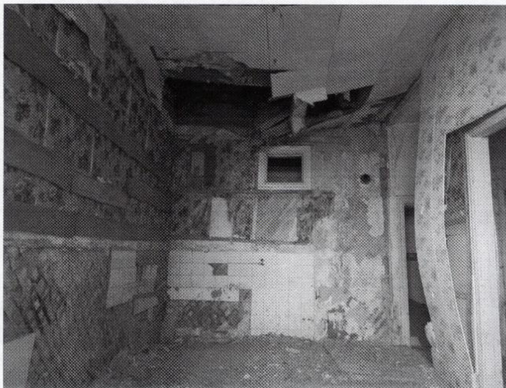
Фото 4. Интерьер объекта. Фото 2025 г.