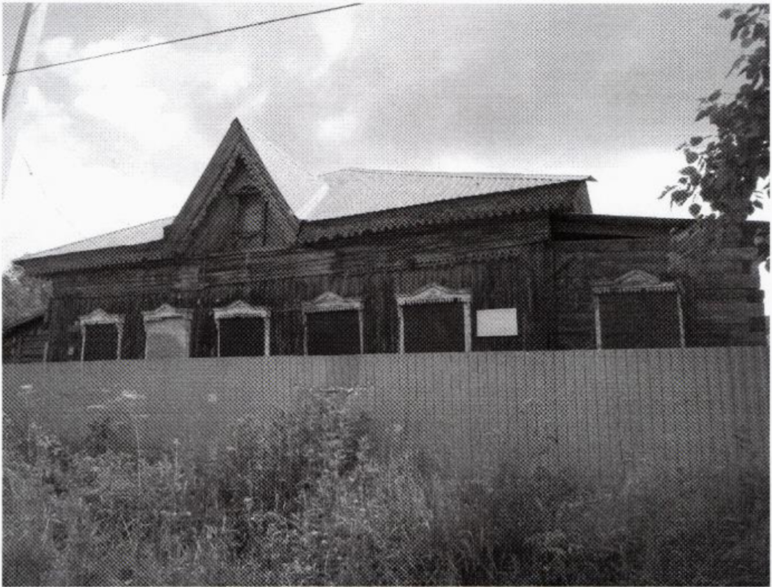
Фото 1. Объект культурного наследия «Дом жилой» (г. Тобольск, г. Тобольск, ул. Горького, 29). Общий вид объекта с севера. Фото 2024 г.