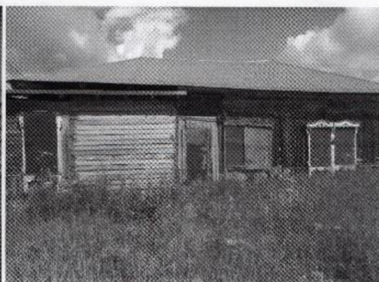
Фото 3. Общий вид объекта с востока. Фото 2025 г.