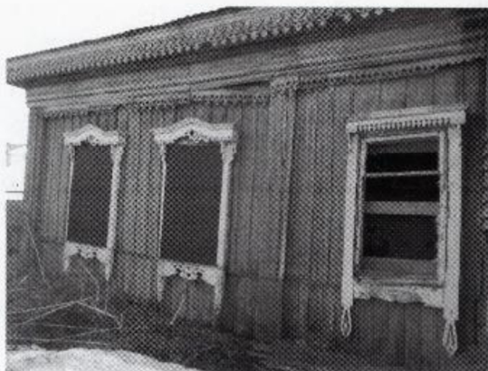
Фото 2. Общий вид объекта с запада. Фото 2025 г.