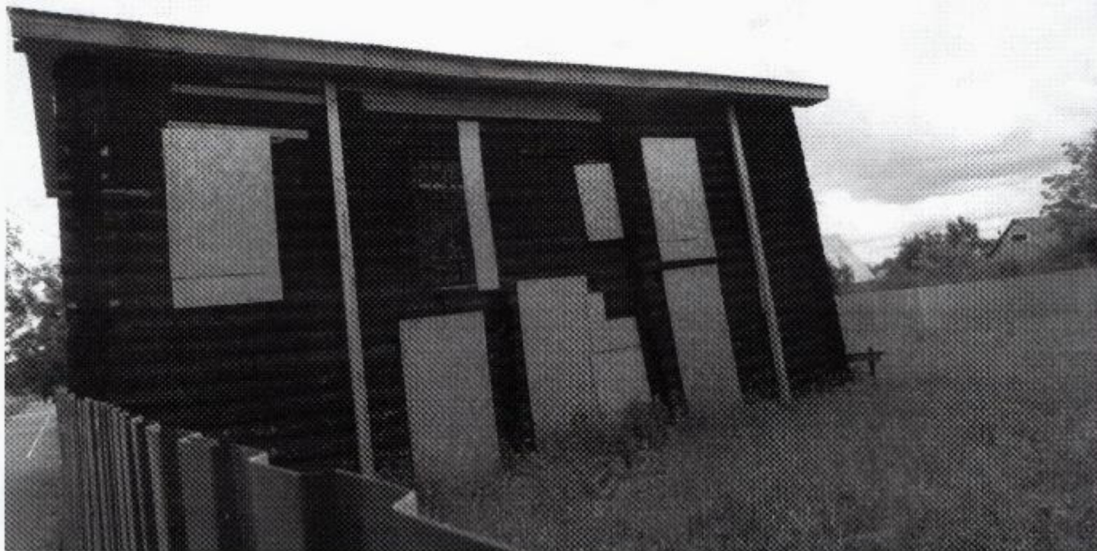
Фото 2. Объект культурного наследия «Дом жилой из состава усадьбы» ( г. Тобольск, ул. Ленина, 44). Вид на северный фасад объекта. Фото 2025 г.