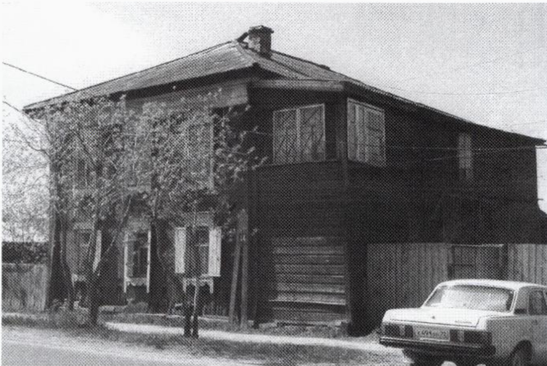
Фото 3. Объект культурного наследия «Дом жилой из состава усадьбы» ( г. Тобольск, ул. Ленина, 44). Общий вид объекта. Фото 2004 г.