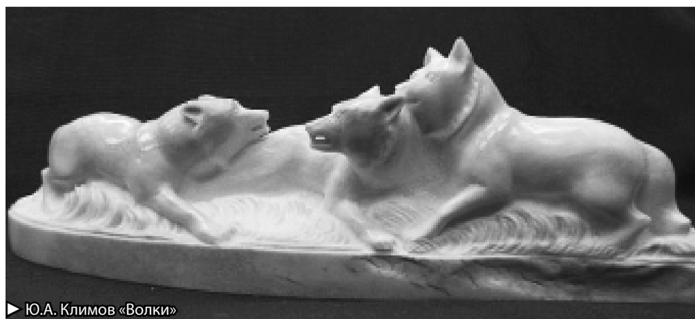
Ю.А. Климов «Волки»

Ещё ребёнком я часто приходила к маме на фабрику. Меня очень увлекали эти маленькие фигурки, процесс изготовления и сама атмосфера фабричного коллектива. Стоя у маминного верстака, я наблюдала, как её руки вырезают бегущего оленя. Я часто представляла себе, что, когда вырасту, так же буду работать на фабрике, как моя мама. Буду стоять у станка и умело обрабатывать косточку, а потом вырезать из неё красивую фигурку. В 2007 году я пришла на косторезную фабрику и прошла обучение у мамы. Сейчас я мастер 4 разряда и продолжаю нарабатывать свое мастерство.