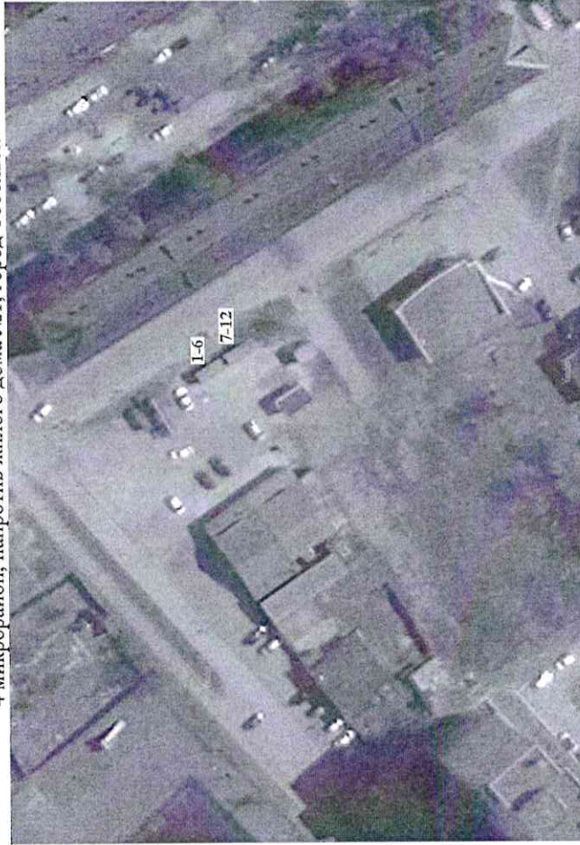
Схема размещения торговых мест на универсальной ярмарке «Тобольская муниципальная ярмарка» 4 микрорайон, напротив жилого дома №1, город Тобольск

Приложение к Порядку организации универсальной ярмарки «Тобольская муниципальная ярмарка»