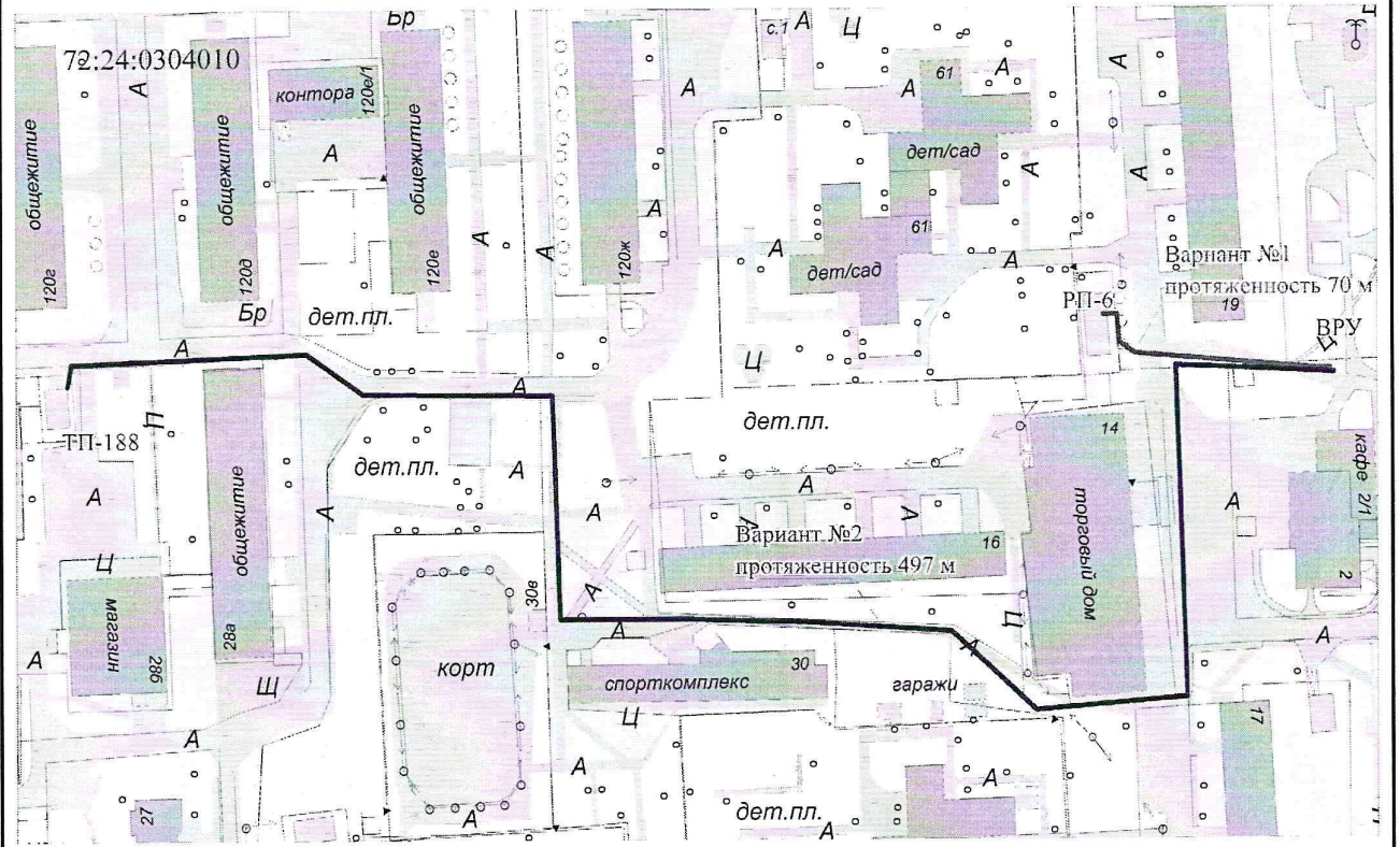
Масштаб 1 : 1800