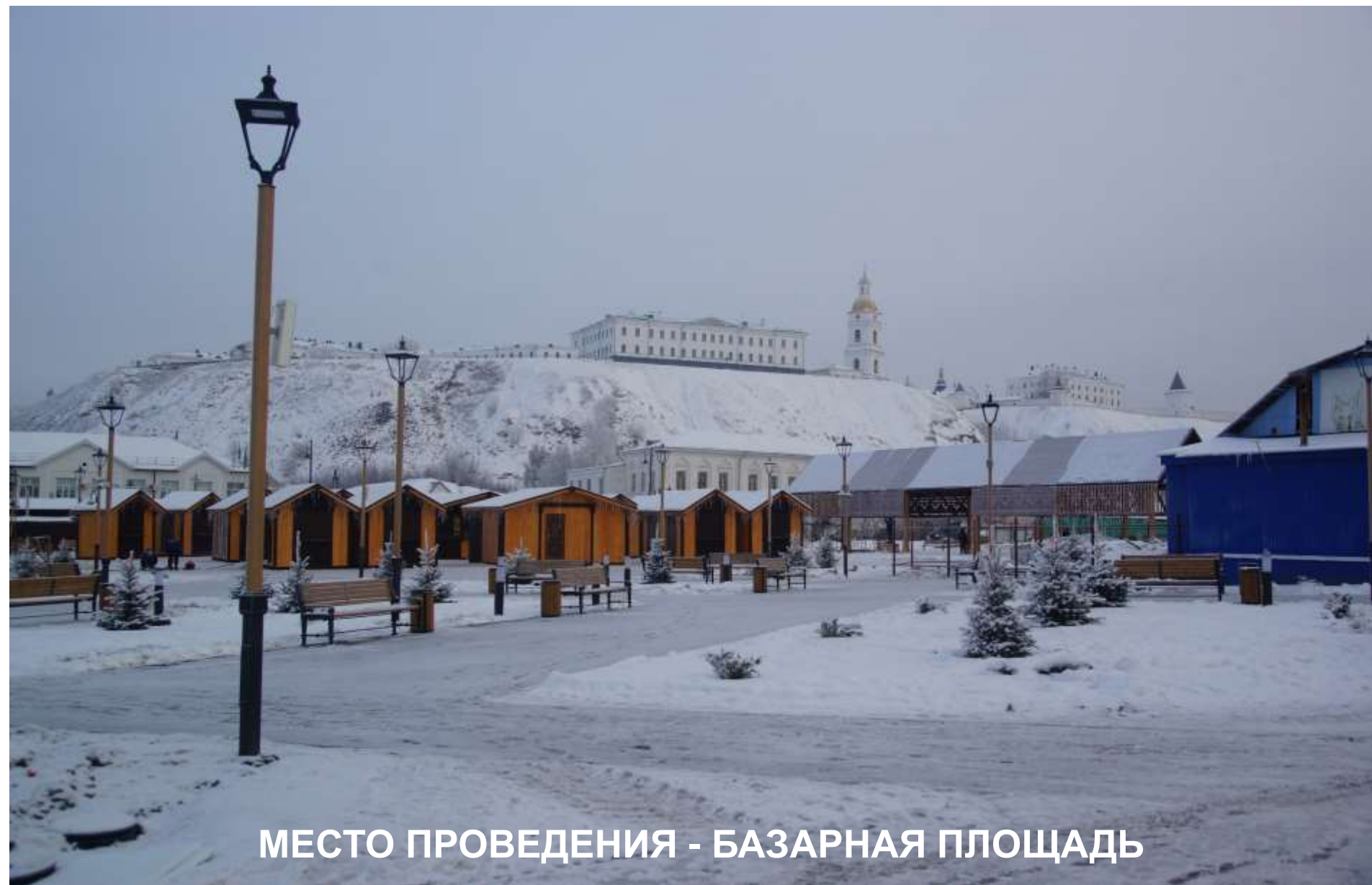
МЕСТО ПРОВЕДЕНИЯ - БАЗАРНАЯ ПЛОЩАДЬ